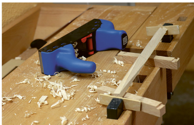
La pièce à raboter est serré dans l'étau de l'établi.