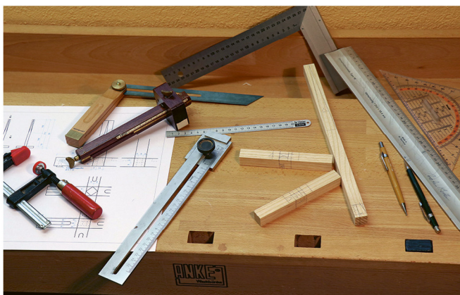
Les pièces tracées sont prêts à être travaillées.